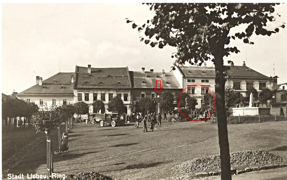
Libavské náměstí. Šipka ukazuje na označení místa četnické stanice, v kruhu je sousoší sv. Floriána a sv. Jana Nepomuckého, o kterém je v příběhu taky řeč.