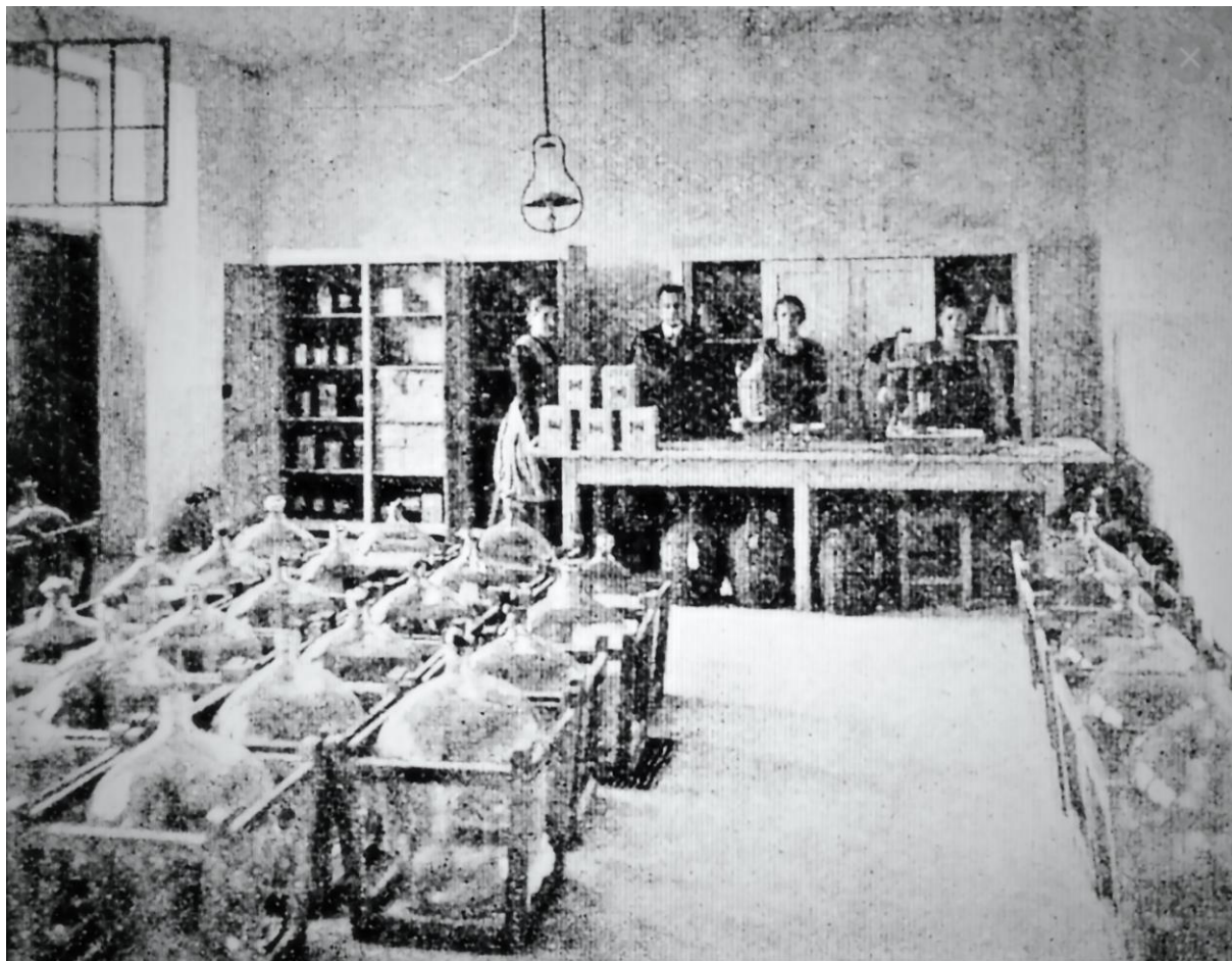
Skutečná výroba Francovky. Kopie fotografie z reklamního letáku firmy z roku 1930.

jak to tady trefně nazval Hrubčák, zavezte kurýrem do Olomouce na soudní k rozboru!" Nasadil si čepici a šel někam, asi k lékárníkovi na skleničku.